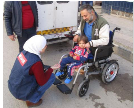
Mahshi mit seiner jüngsten Tochter und einer MEDIAIR-Mitarbeiterin

größte Geschenk, das MEDIAIR Mahshi machen konnte war ein elektrischer Rollstuhl. Seine Freunde helfen ihm, von seiner Notunterkunft in den Rollstuhl zu kommen. Seither haben MEDIAIR-Teams Mahshi mehrere Male getroffen, draußen mit seinen Freunden, mit seiner Familie, an der Schule mit seiner jüngsten Tochter. Bei der letzten Begegnung lachte Mahshi mit seiner kleinen Tochter und sagte uns: "Danke, dass Ihr mir die Möglichkeit gegeben habt, die Sonne zu sehen, in den Straßen zu sein, Freunde zu treffen, und am allerwichtigsten meine Familie zu begleiten."