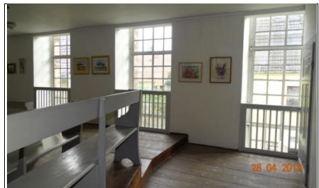
Ausstellung der Tannrodaer Hobbymalerin Waltraud Pfeiffer im April 2018